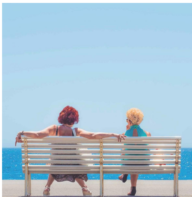
„Two ladies on a white bench“, Juni 2017. Preisgekröntes Bild von Pia Parolin