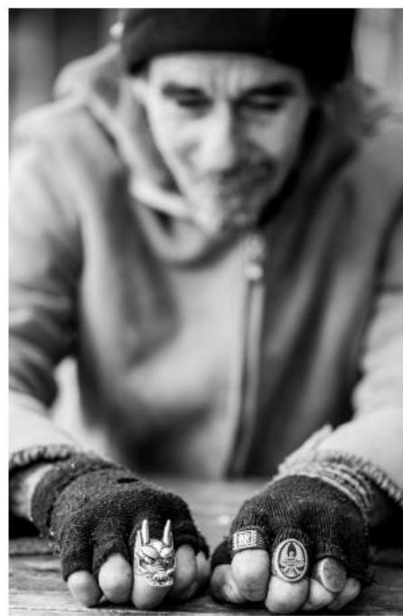
Withmore Square © Hannah B. Walker

Samedi, le 21 janvier 2017 à 19h | soirée exclusive à la Place de Mougins