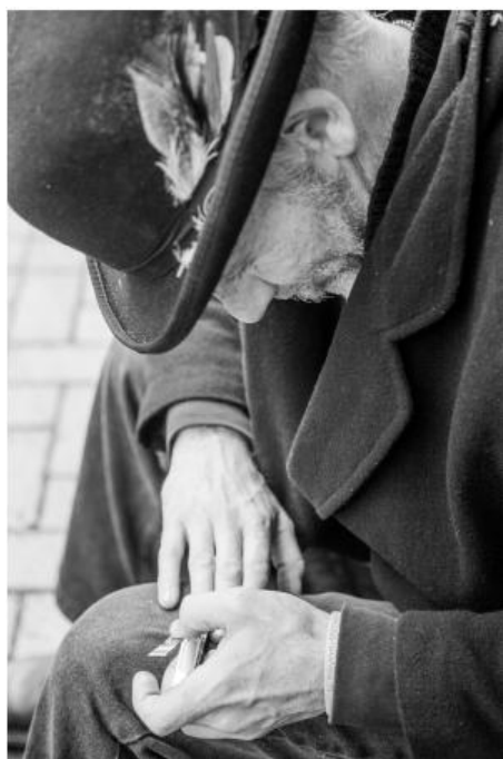
Huff Street

Dans la série Urban Multiplication , Hannah utilise une combinaison de techniques analogues et de la manipulation digitale des techniques analogues combinées à de la manipulation digitale. Grâce à sa double approche, elle nous présente son rapport personnel avec la ville, notamment une amplification de chaos et de découvertes qui bousculent nos sens.