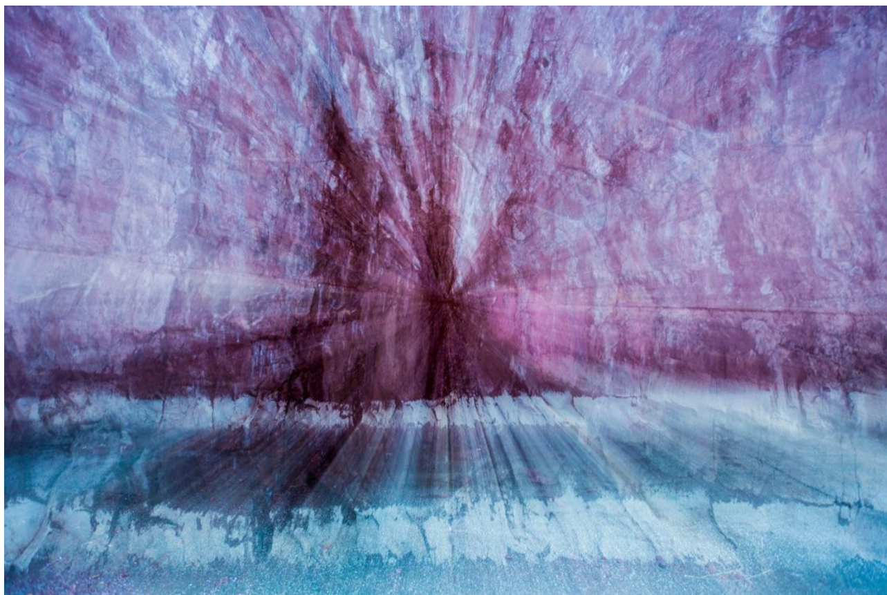
Then and Now , Vallée des Merveilles, France, 2016

Pour cette première édition nous avons choisi de vous présenter une jeune photographe, Hannah B. Walker , qui a déjà une œuvre d'une profondeur extraordinaire, mais qui n'a jamais eu l'occasion de montrer sa création en Europe.